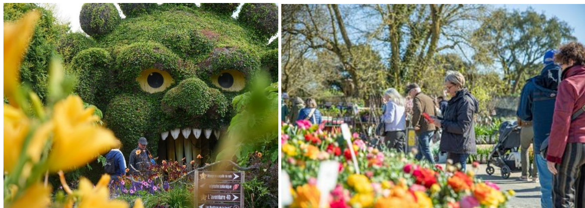
Ci-dessus : Les Printemps de Terra et son grand marché aux plantes - en bas : le grand temps fort de la Fête de l'Automne

En fin de saison, La Fête de l'Automne reviendra lors des deux premiers week-ends d'octobre puis du 17 octobre au 1 er novembre, avec une immersion haute en couleurs où animations, spectacles et attractions seront revisités au milieu de milliers de cucurbitacées.