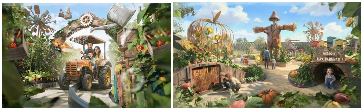
En haut, la nouveauté : « Le Potager de Cléamolette ». En bas, le nouveau tableau de Terra Nocta et « Les Printemps de Terra »

Terra Botanica offrira de nombreux temps forts qui marqueront la saison 2026 : « Les Printemps de Terra » les 28 et 29 mars, le plus grand marché de plantes du Grand ouest ; le festival « Les Envolées Végétales » en juillet-août et, pour clôturer la saison, la traditionnelle Fête de l'Automne, du 3 octobre au 1 er novembre. Plus d'infos : https://www.terraborotanica.fr/